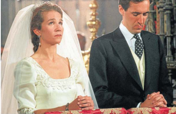
La Infanta Elena y Jaime de Marichalar el 18 de marzo de 1995, fecha en la que contrajeron matrimonio