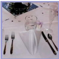
Cómo confeccionar el menú de boda.