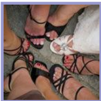
Damas de honor