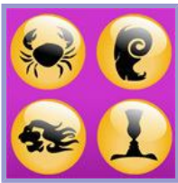
Horóscopo (del 28 de noviembre al 4 de diciembre)