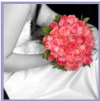
Ramos de novia con personalidad