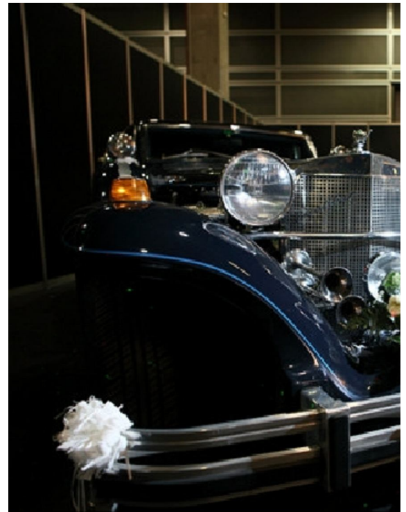
Galería de imagenes

Secretos de Boda en su tercera edición en Valencia descubre a través de conferencias y talleres